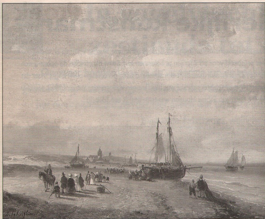
Andreas Schelfhout, 'Elegant gezelschap en vissersvolk op het strand van Scheveningen', olieverf op paneel, 18,4 x 23 cm.