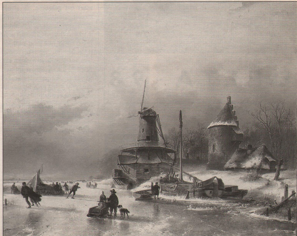
Andreas Schelfhout, 'Schaatsers aan de voet van een molen', 1839, olieverf op doek, 88,7 x 110,7 cm.

"Het werd eigenlijk hoog tijd voor een dergelijk documentatiecentrum", vindt hij. "We kunnen er echt niet omheen dat Schelfhout een van Hollands' beroemdste romantische schilders is geweest, met een enorm oeuvre op zijn naam. Zijn werk, samen met dat van schilders als Barend Cornelis Koekkoek, Johannes Christianus Schotel en Cornelis Springer, was tot ver buiten onze landsgrenzen geliefd en in de negentiende eeuw had iedere serieuze verzamelaar van Hollandse 'eigentijdse' schilderkunst wel een Schelfhout hangen. Een speciale site aan Schelfhout gewijd is dus wel op zijn plaats. Mede door die populariteit is zijn oeuvre echter enorm verspreid geraakt. Veel werk van de schilder werd aangekocht voor koninklijke en adellijke collecties in het buitenland en werd zo uit het oog verloren. Zo nu en dan keert er een schilderij weer in ons land terug. Zo haalden wij onlangs uit Finland een schitterend 'Wintergezicht met veel schaatsers en een