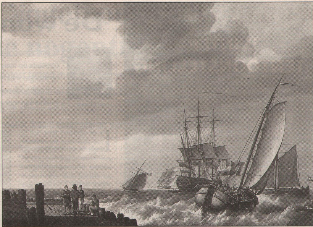
Johannes Hermanus Koekkoek, 'Laverende zeilschepen voor de kust', 1810, olieverf op paneel, 44,8 x 62,2 cm.