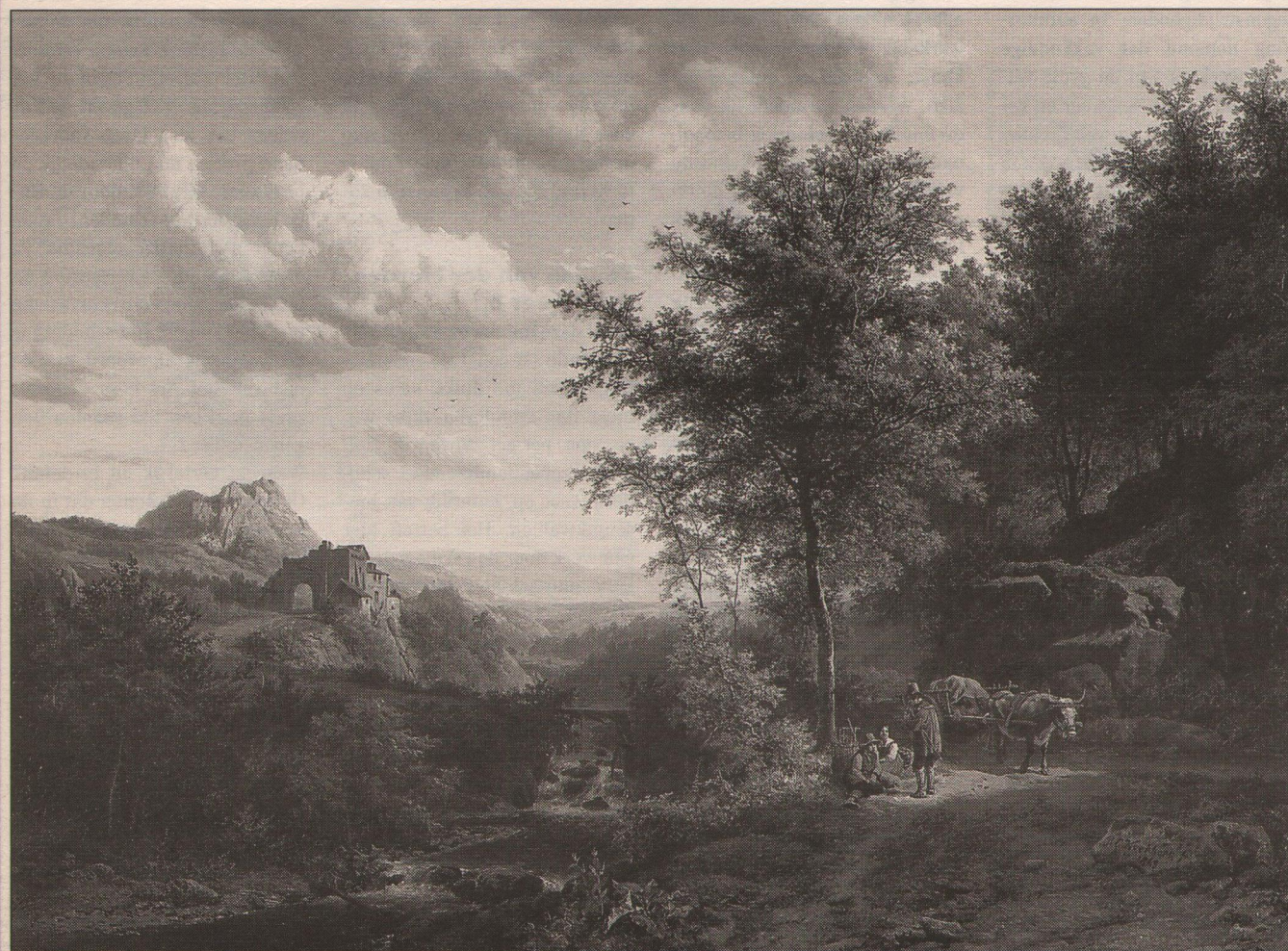
Barend Cornelis Koekkoek, 'Heuvelslandschap met rustend boerenvolk onder een eik', 1843, olieverf op paneel, 38,5 x 51,9 cm.