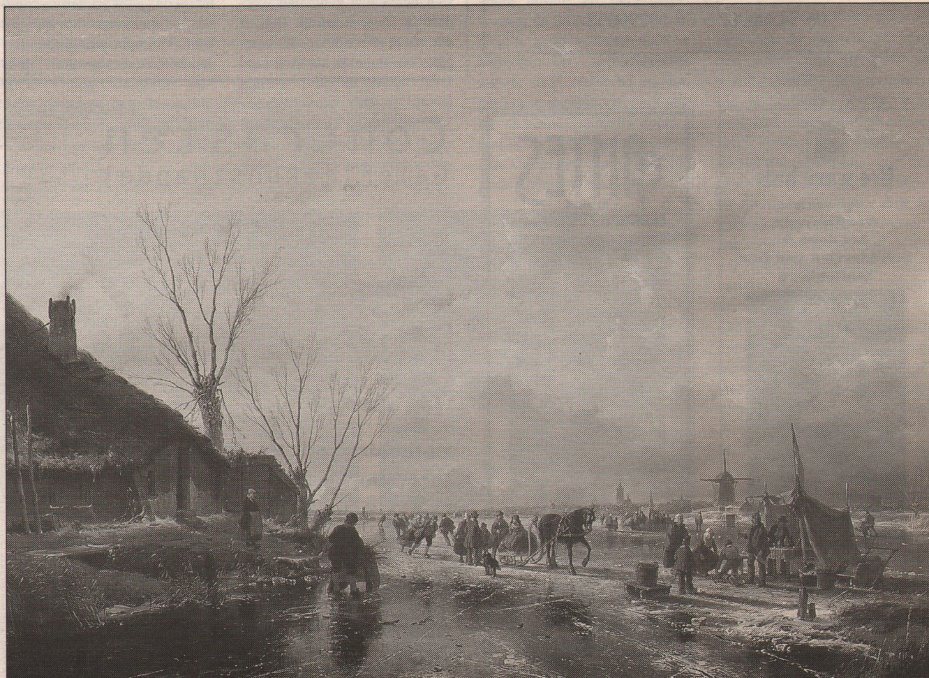
Andreas Schelfhout, 'Ijsvertier op een zonnige winterdag', 1850, olieverf op paneel, 55 x 74,5 cm.

SCHILDERIJEN BRONZEN BEELDEN ANTIËKE MAHONIE MEUBELEN open: woensdag t/m zondag, 12-17 uur telefoon 070-4277408 NOORDEINDE 95 - DEN HAAG U vindt onze collectie ook op Internet www.henkbroeke.nl